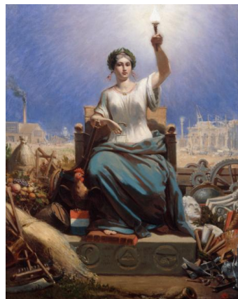
Ange-Louis Janet, La République , 1848.