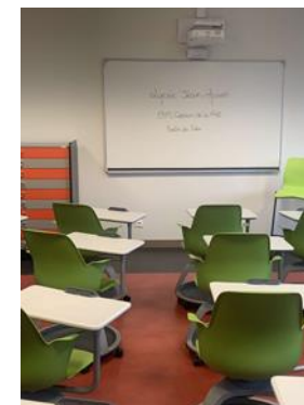
Salle du Futur

Les élèves ont accès régulièrement au parc informatique nouvellement installé et peuvent accéder également à la salle du Futur.